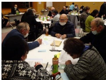
【グループ内で情報交換】