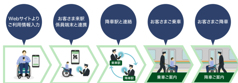
「JRE おでかけサポート」イメージ図

サービス開始日：2024年2月26日(月)※2024年2月28日(水)以降ご利用分から受付開始します。