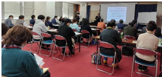
11月8日(水) 岩泉町 「岩泉町民会館 大会議室」

弁護士による障害者差別解消法についての研修会が11月「岩泉町」、12月「一戸町」、令和6年2月「紫波町、紫波町役場」の3箇所において開催されました。3会場には多くの方々が研修会に参加しました。