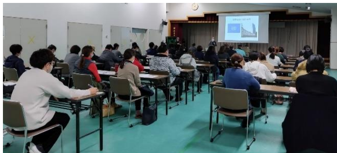
12月15日(金) 一戸町 「一戸町総合保健福祉センター ふれあい交流室」