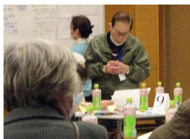
【まとまった内容を発表】