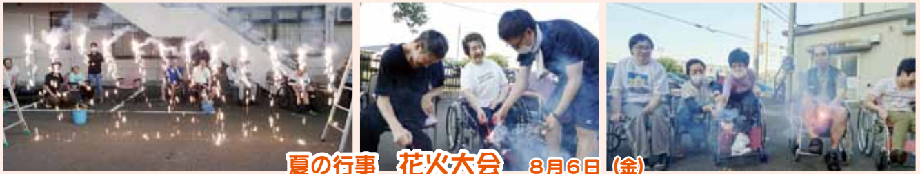
夏の行事 花火大会 8月6日(金)