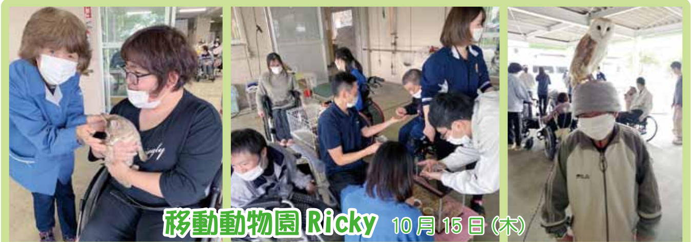
移動動物園 Ricky 10月15日(木)