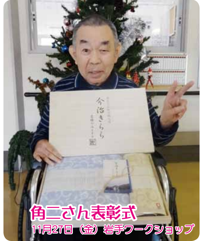
角二さん表彰式 11月27日(金) 岩手ワークショップ