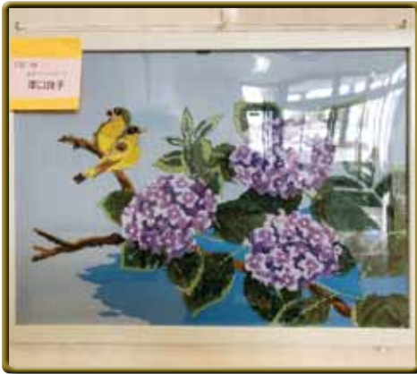
澤口良子さん 作品